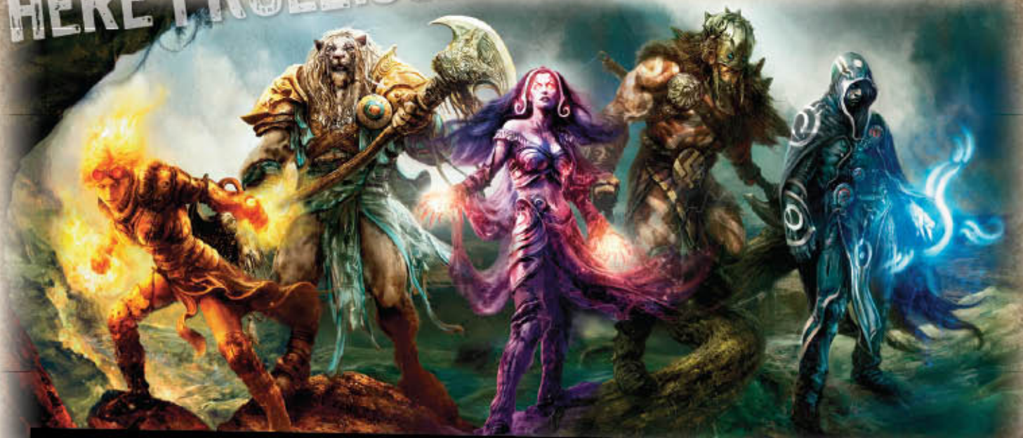
Illustration: Alexei Brindox